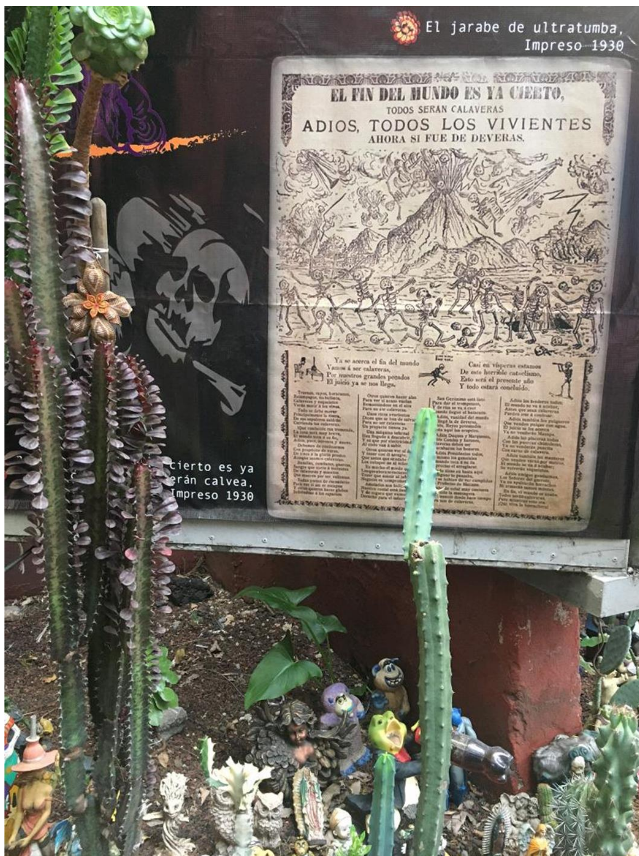
Mercado de Artesanías de Coyoacan, 2022.